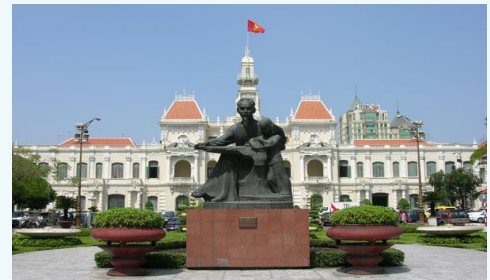
Ho Chi Minh City People's Committee

11 th Floor, HUD Building, No. 159 Dien Bien Phu Ward 15, Binh Thanh District, Ho Chi Minh City Tel: (84-28) 3840 6618 Fax: (84-28) 3840 6616 Email: vacohcm@vaco.com.vn