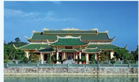
Tran Bien Temple of Literature

No. 79 Ha Huy Giap Street, Quyet Thang Ward Bien Hoa City, Dong Nai Province Tel: (84-251) 382 8560 Fax: (84-251) 382 8560 Email: vacodongnai@vaco.com.vn