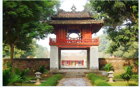
Khuê Văn Các

Tầng 12A tòa nhà Tổng Công ty 319, Số 63 Lê Văn Lương, P. Trung Hòa, Q. Cầu Giấy, Tp. Hà Nội ĐT: (84-24) 3577 0781 Fax: (84-24) 3577 0787 Email: vacohn@vaco.com.vn Website: www.vaco.com.vn