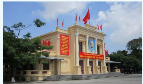
Nhà hát Tp. Hải Phòng

MHT05-04 Vinhomes Imperia Hải Phòng P. Thượng Lý, Q. Hồng Bàng, Tp. Hải Phòng ĐT: (84-225) 353 4655 Fax: (84-25) 353 4316 Email: vacohp@vaco.com.vn